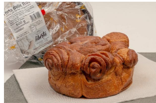
Torta delle rose