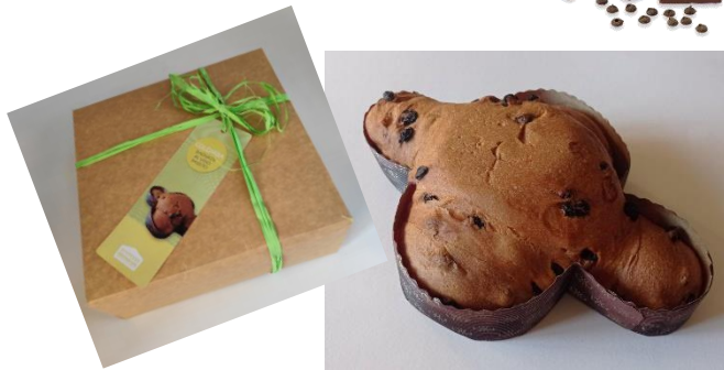
Colomba bagnata al vino passito