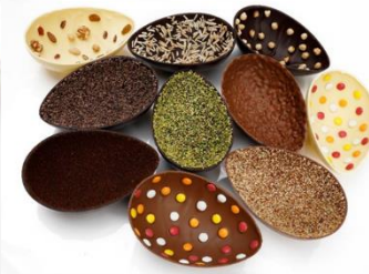
Cioccolato artigianale decorato