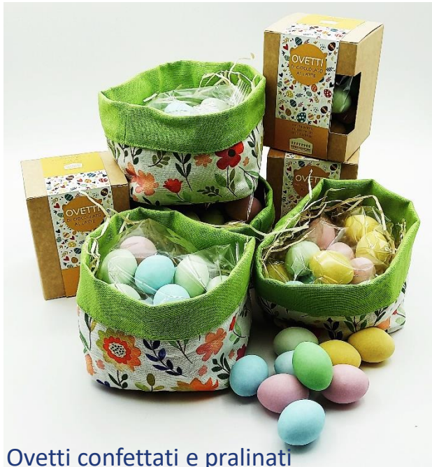
Ovetti confettati e pralinati